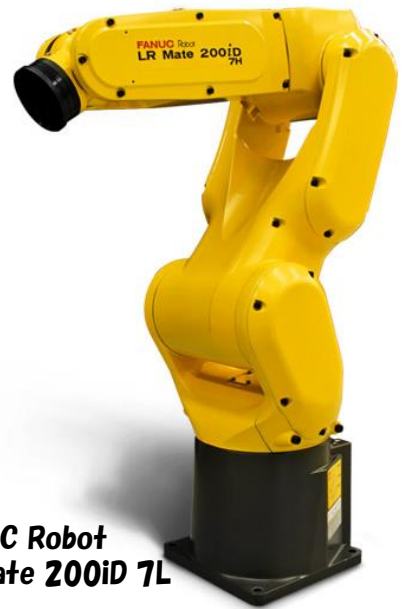
FANUC Robot LR Mate 200iD 7L

プログラミングを弊社にて行うことで ワイヤ機へのロボット後付けを可能にしました！！