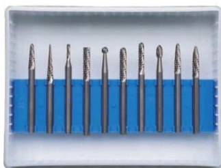
超硬カッター(10本)セット K0090