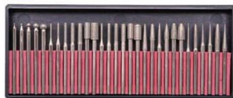
電着ダイヤモンド砥石(30本)セット D0090